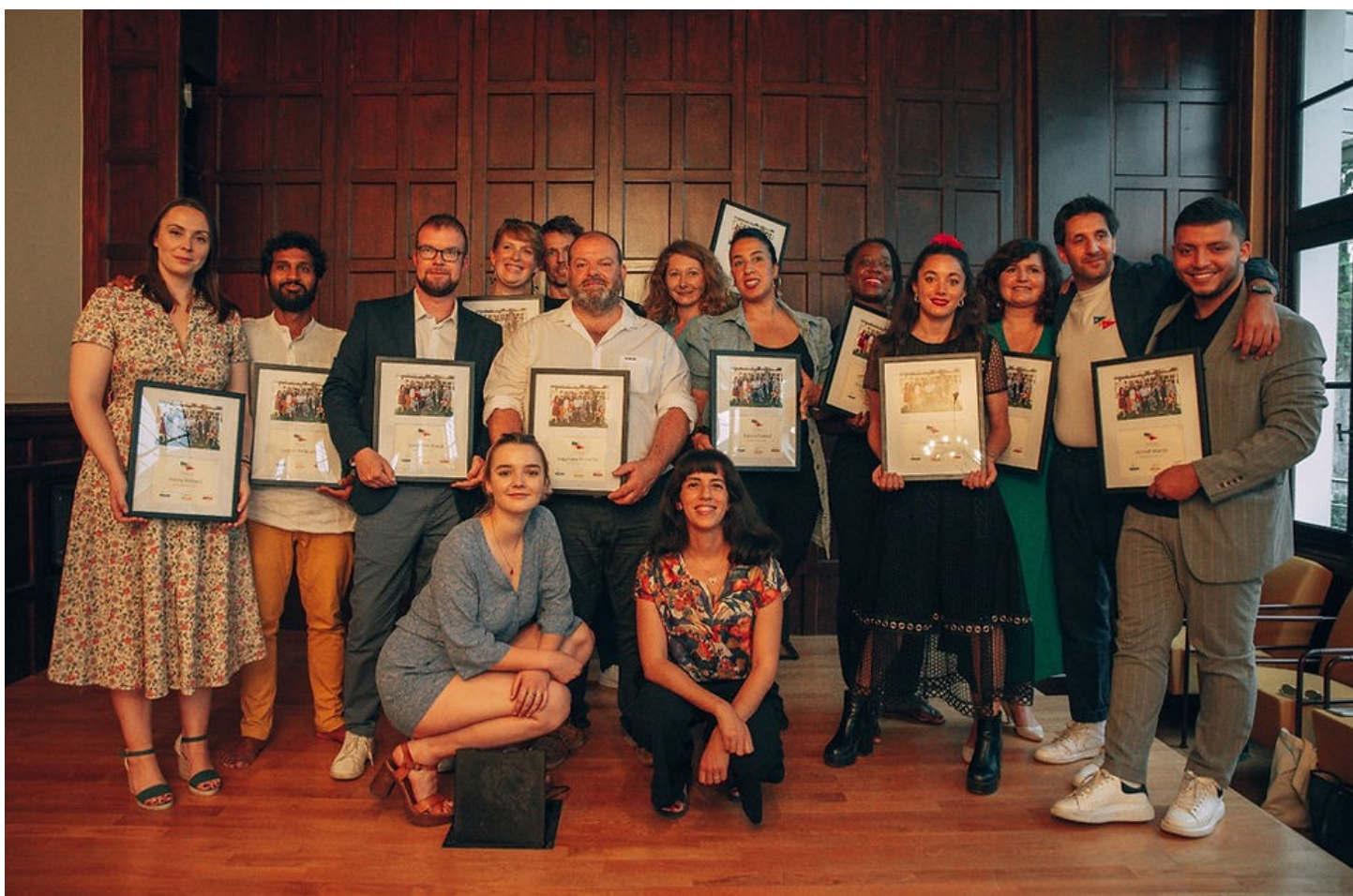
Promotion inaugurale de l'AFL, lors de la cérémonie de diplomation, juin 2022

Les autres candidats se sont ensuite tournés vers la création d'association ou de nouveaux projets .